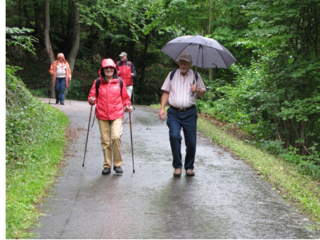
Ein warmer Regen.