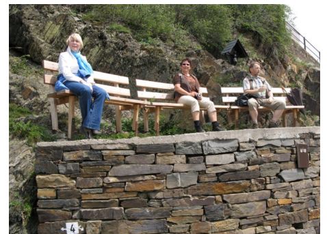
Jedem seine Bank.