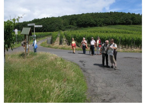
Warten auf ein Wunder.