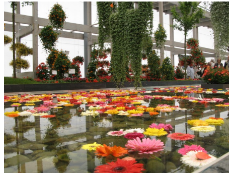
Blüten- Meer (Mehr)